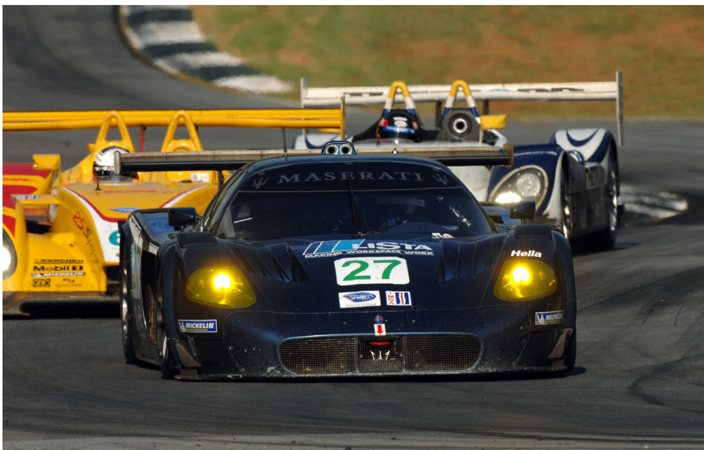
ALMS, Road Atlanta, Maserati MC12: Andrea conquista la prima pole della storia dell'ALMS per Maserati alla Petit Le Mans ALMS, Sebring, Maserati MC12: Andrea took the first pole position ever in the history of Maserati in the ALMS during the 10th Anniversary of the Petit Le Mans.