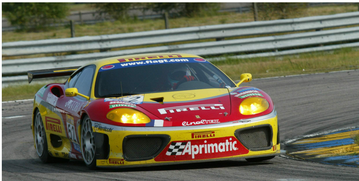
FIA GT, Estoril, Ferrari 360 Modena GT: 2° successo in carriera