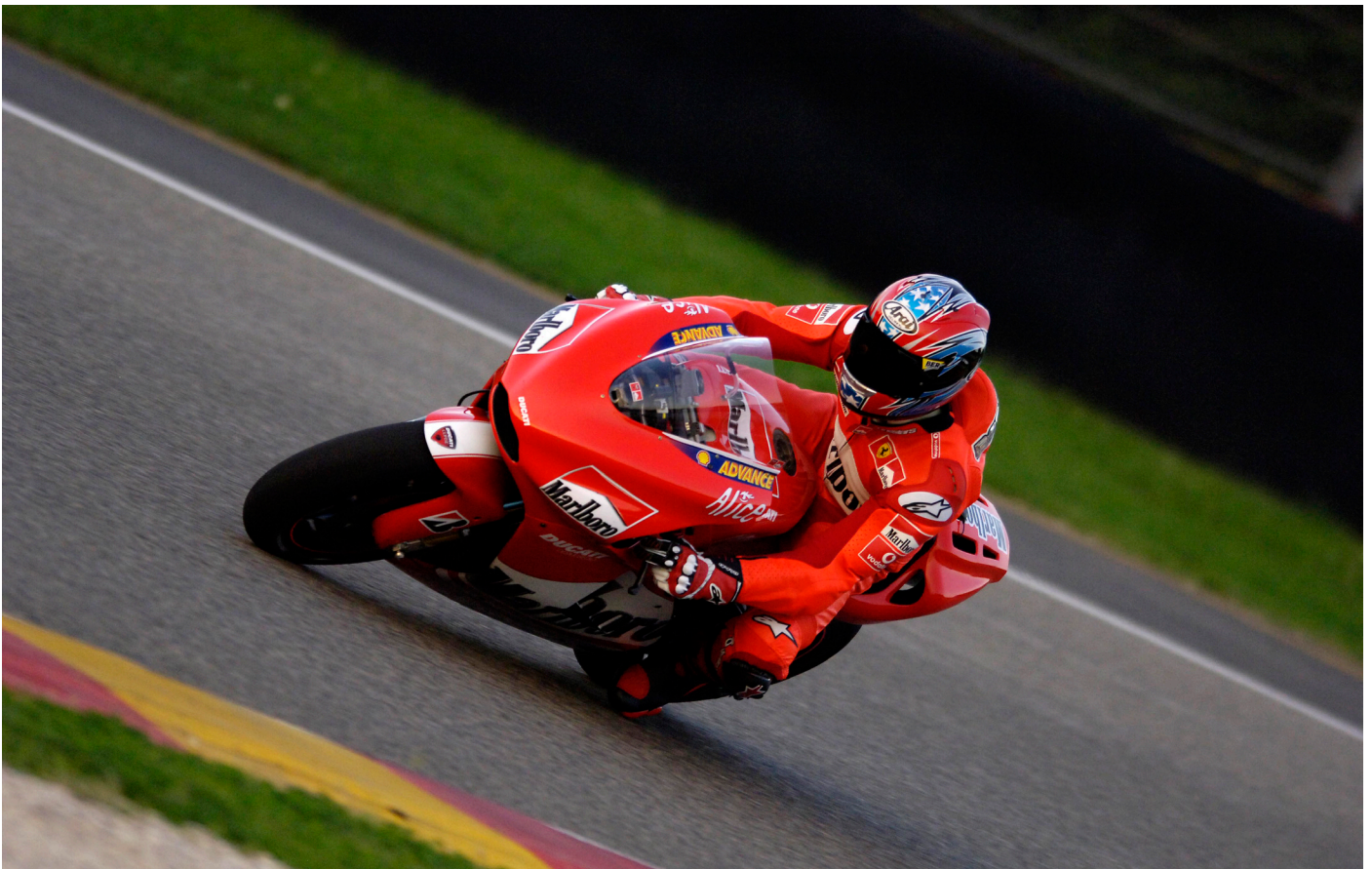
Mugello, Ducati Desmosedici GP1: Andrea in azione durante un test con le Ducati ufficiali della MotoGP Mugello, Ducati Desmosedici GP1: Andrea riding the official MotoGP Ducati during a test