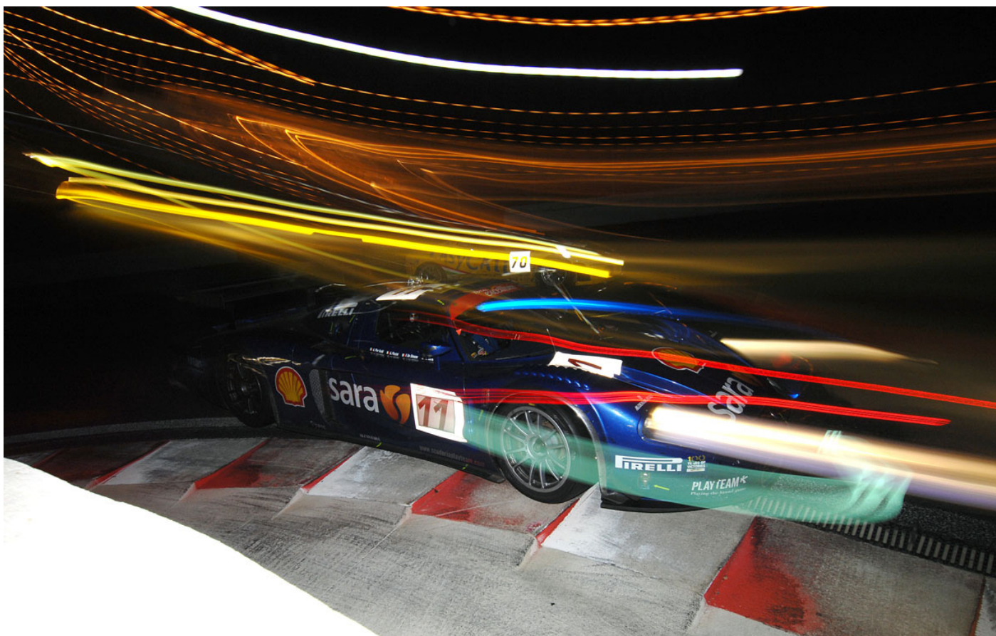
FIA GT, 24 Ore di Spa, Maserati MC12: Andrea in azione con la vettura del PlayTeam Sarafree FIA GT, 24 Ore di Spa, Maserati MC12: Andrea in action with the PlayTeam Sarafree MC12